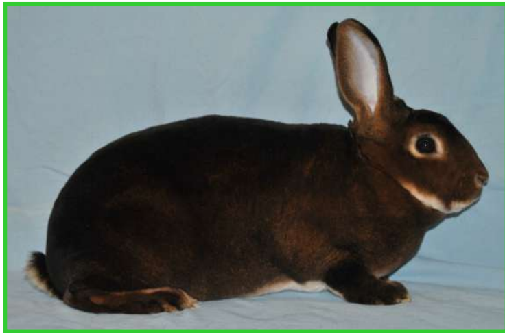
Petit rex (standard au 1er septembre 2022)